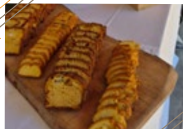
Planche de charcuterie - 2 pièces par personne

Assortiment de feuilletés (poissons, fromages, saucisses)